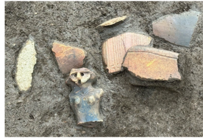
土偶等出土状況（堀之内式期）

これまでに発掘調査が終了した周辺の調査区でも、住居や配石が発見されています。その調査成果を繋げることで、縄文時代後期におけるこの秋山の台地には、敷石住居に配石群を伴う集落が、あるまとまりをもって複数存在していた景観が復元できます。