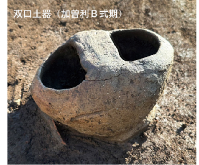
双口土器（加曾利B式期）